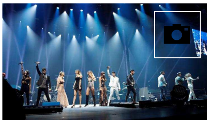
📷 Concierto de Operación Triunfo en Madrid