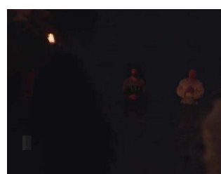
▶ 'Tomb raider' llega fin de semana a los c

© Prensa Malagueña, S.A. Domicilio social en Málaga, Av. Dr. Marañón, 48.