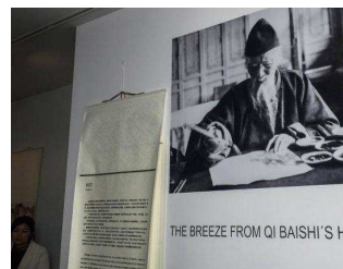
📷 El Museum Jorge de Málaga presenta primera vez fuera de la obra del cotizado Baishi