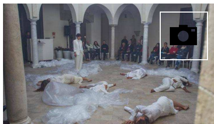
📷 Presentación del cartel de la Noche en Blanco de Málaga 2018